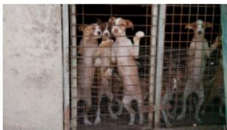
MAUS-TRATOS A ANIMAIS

Jovem acusado de matar cadela à pancada conhece sentença na quinta-feira