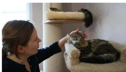
MAUS-TRATOS A ANIMAIS

As autoridades foram alertadas para os alegados maus-tratos por denúncia anónima. "Percorremos o perímetro da exploração, e fora dela, e não encontramos animais mortos", informa o veterinário.