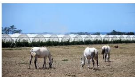
MAUS-TRATOS A ANIMAIS

Jovem acusado de matar cadela à pancada conhece sentença na quinta-feira