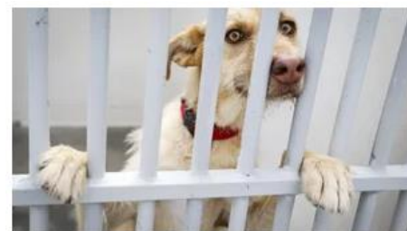
MAUS-TRATOS A ANIMAIS

Cães vítimas de maus-tratos resgatados em Viseu