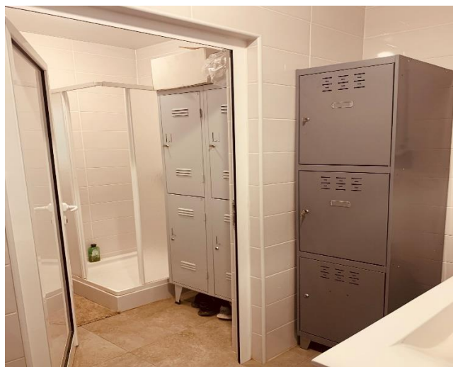
Boas instalações para higiene e balneários para duche antes da entrada nos alojamentos são importantes para prevenir a transmissão de doenças