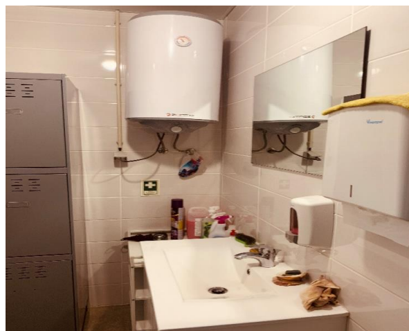
Uma boa higiene das mãos é importante sempre que entramos nas instalações

A formação e a sensibilização do pessoal agrícola para os procedimentos não excepcionáveis, são fatores-chave para o sucesso das medidas de biossegurança