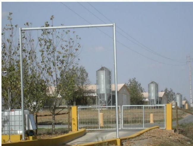
Exploração com medidas de biossegurança tomadas antes da entrada de visitantes.

A adoção destas medidas envolve a instalação de barreiras físicas (redes e portões) e a instalação de vestiários capazes de funcionar como filtros sanitários.